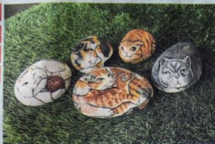
▲狗及猫彩绘是最受欢迎的石头画，生动的彩绘赋予石头新生命。