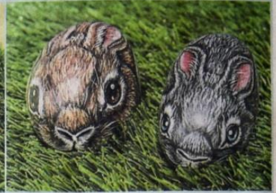
▲两只可爱乖巧的小兔子静静的呆在草地上。