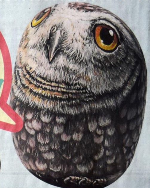
▲神情各异的猫头鹰，让人爱不释手。