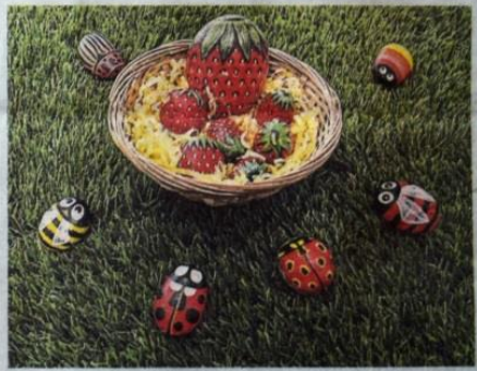
▲想咬一口。以假乱真的草莓，似乎让可爱的甲虫也忍不住。